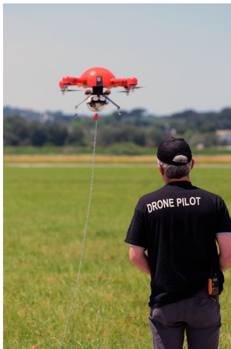
Tra un mese "Roma drone 2016" sull'aeroporto

La pandemia e il lockdown non fermano la passione per i droni. Nonostante le limitazioni anti-Covid, infatti, dal marzo scorso ad oggi sono stati rilasciati oltre 45mila "attestati di pilota" per attività di volo in aree non critiche, una sorta di "patentino" che può essere conseguito tramite un esame online sulla piattaforma dell'Ente Nazionale per l'Aviazione Civile (ENAC). E' un vero boom, in gran parte relativo ad appassionati (molti sono giovani) che amano pilotare il loro piccolo drone per divertimento, scattare fotografie dall'alto o realizzare brevi video. A questi, si aggiungono coloro che hanno conseguito l'abilitazione di pilotaggio per motivi professionali, come videomaker, geometri e ingegneri: ad oggi, i circa 80 centri di addestramento per APR (Aeromobili a Pilotaggio Remoto) presenti in tutta Italia hanno rilasciato oltre 25mila attestati per attività di volo in aree critiche e non critiche. Questi dati saranno al centro della prossima puntata di "Roma Drone Webinar Channel" (RDWC), il canale in diretta streaming su normativa, tecnologia e business dei droni, che si svolgerà dopodomani giovedì 26 novembre sulla pagina Facebook @romadrone sul tema "A scuola di droni. La formazione dei piloti APR tra centri di addestramento, corsi online e esami a distanza".